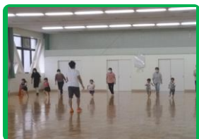
年少・年中・年長親子運動