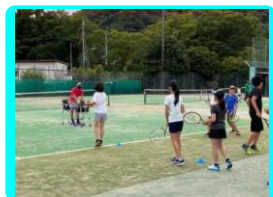
小学生硬式テニス