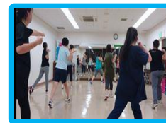
リズムボクシング