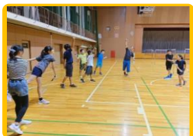
初級バドミントン